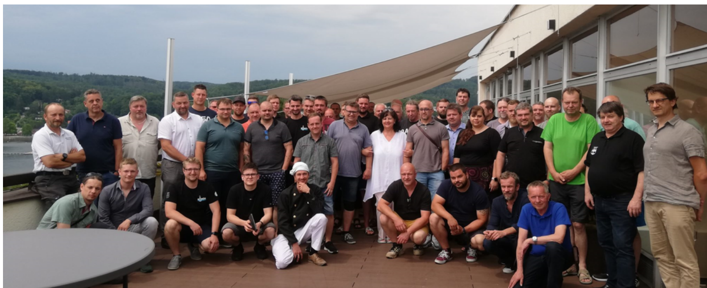
členové Moravského kominického společenstva